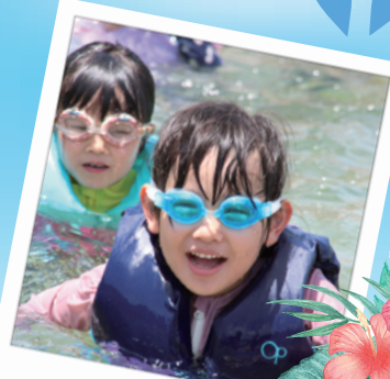
海っ子デイキャンプ