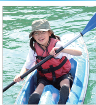
阿南マリンキャンプ